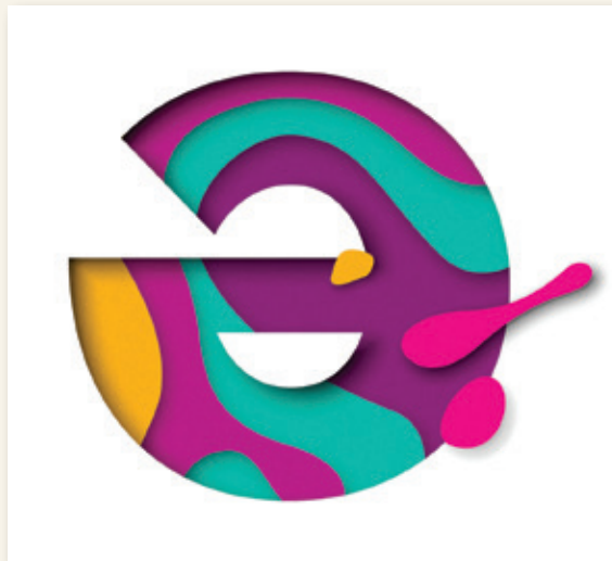
Questa lettera di chiama schwa e si pronuncia scevà

La lingua greca e latina comprendevano l’utilizzo di un terzo genere grammaticale , oltre a maschile e femminile: il neutro, che si usava per animali