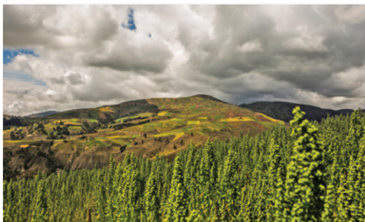
In queste foto: coltivazioni di quinoa in Perù e lavoratori del cacao in Ecuador

L'azione di Mandacarù, come ha descritto dal direttore Giovanni Bridi – mira a rinforzare lo sviluppo della finanza popolare in