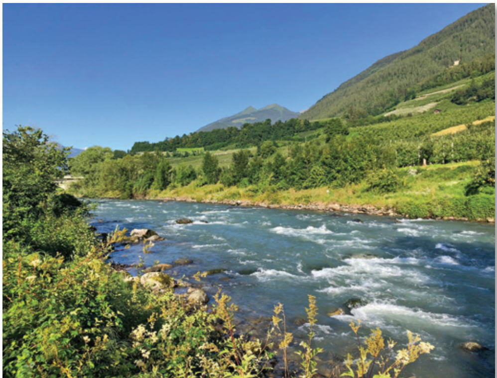
Il fiume Noce

Il documento può riassumersi in estrema sintesi attraverso cinque punti-cardine. Attraverso questi punti (che il